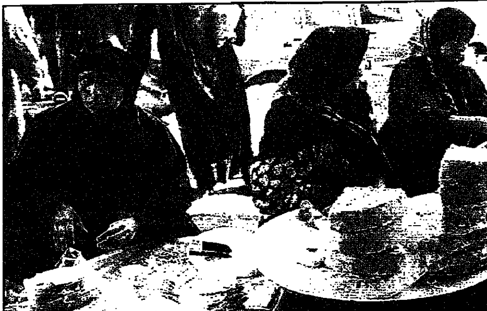
سيدات عزيمات في احد اسواق بغداد

عمان - تعتبر الحكومة العمانية تسوية الازمة بين ايران والاتحاد الاوربي وشيكة.